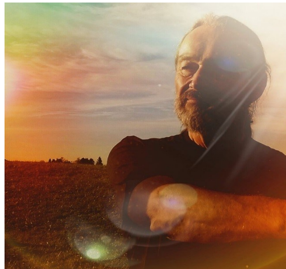
ICH BIN DER GUTE HIRTE (Joh 10,11-14)

Schriftverkehr: Befreiung des Deutschen Volkes