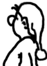
Der dumme deutsche Michel mit der Schlafmütze

Allein diese drei unerschütterlichen Fakten beweisen den Vertragsbruch der Politik und des Staates gegenüber dem Deutschen Volk. Und was passierte? Nichts passierte, das Deutsche Volk steht diesem unkontrollierbaren Staat hilflos gegenüber, wie in Goethes ZAUBERLEHRLING treffend beschrieben. Die Besen im Gleichnis schleppen Wasser heran und die Politik, der Staat schleppt Schulden heran in denen das Deutsche Volk ersäuft wird. Und, wer kann diesen untreuen Staat stoppen? Sagen Sie es mir, wenn Sie eine Antwort haben. Die Meinung des Deutschen Volkes = Arbeitgeber spielt für den Staat = Arbeitnehmer nicht die geringste Rolle mehr. Und das HILFLOSE DEUTSCHE VOLK STEHT DA UND GLOTZT DUMM AUS DER WÄSCHE!